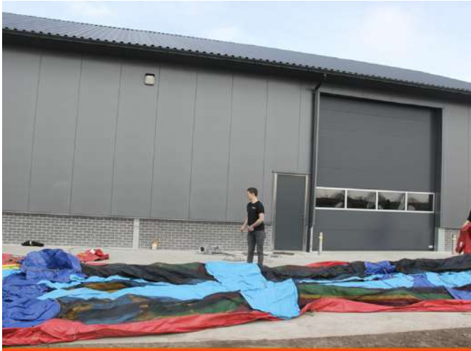
5. Vouw de andere kant van het kussen uit;